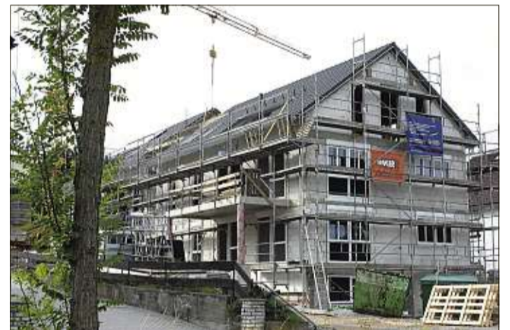
Auf'richt ist! In wenigen Monaten sind die Wohnungen an der Glocke, neben der Hirsch-Apotheke, bezugsfertig.

fahrer und Hundebesitzer freu- en sich dagegen über die Nähe zum Studentenwald, Familien über Röhrensee, Kindergarten und Schule in Laufweite. Auch lauschige Biergärten sowie die Bushaltestelle sind nur wenige Meter von der Haustür entfernt. Die Ausstattung kann sich sehen lassen: Moderne und Komfort waren die Maßgaben, die den Rahmen für die Planer setzten. Große Fensterflächen schaffen