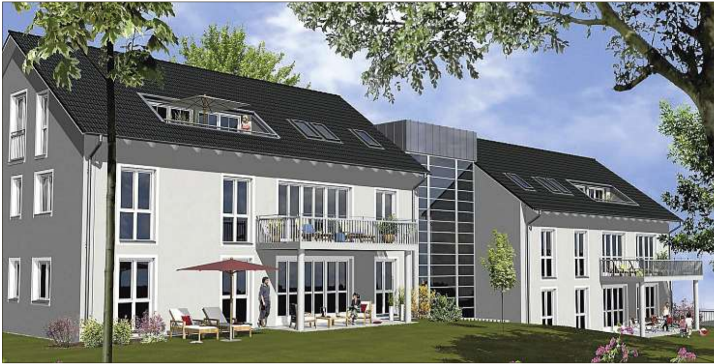
So wird sie einmal aussehen, die neue Wohnanlage am Studentenwald. Die Fertigstellung ist für Ende 2011 vorgesehen.

Wohnen in der Wagnerstadt ist gefragt: Das stellen nicht nur Studenten fest, die auf der Su- che nach einer erschwinglichen Bleibe für ihre Studienzeit sind. Auch Ältere, die sich eventuell wieder nach einer Wohnung in- nerhalb der Stadtgrenzen um- sehen, nachdem die Kinder aus dem Hause sind, müssen oft schmerzlich feststellen: Hoch- wertige innerstädtische Woh- nungen, in ruhiger Lage und vielleicht auch noch in erlau- fbarer Distanz zu Supermarkt, Bäcker und Metzger sowie Arzt